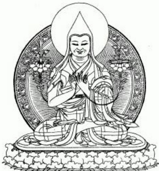
Je Tsongkhapa Lobsang Dragpa, der Begründer der Gelug-Tradition