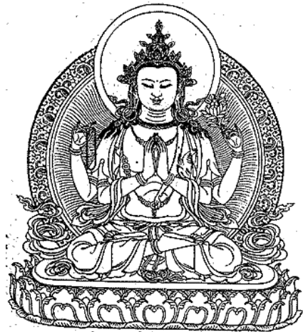
Chenresig, der Buddha des Mitgeföhls